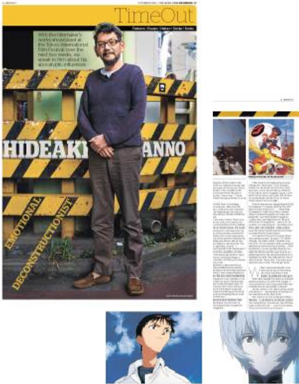
2014 年 10 月 19 日 庵野秀明氏の記事