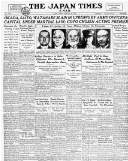
1936年2月28日 反乱部隊蜂起。 帝都に戒厳令(2.26事件)