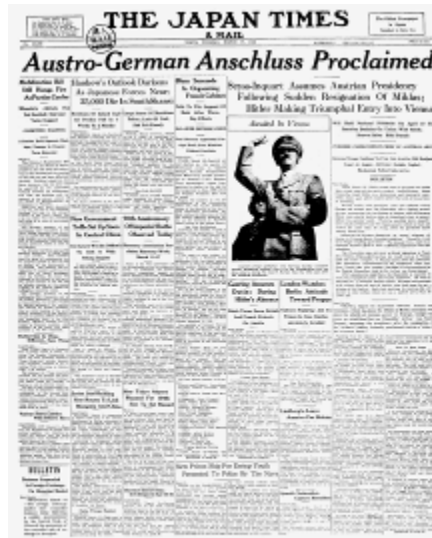
1938年3月15日 ドイツ、オーストリア併合を宣言