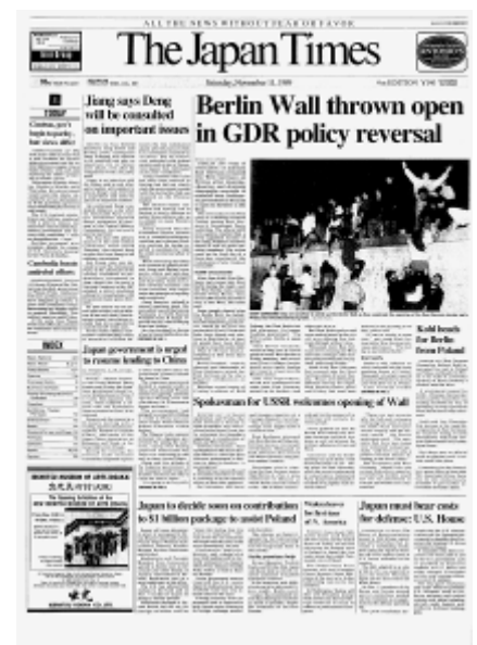
1989年11月11日 ベルリンの壁崩壊