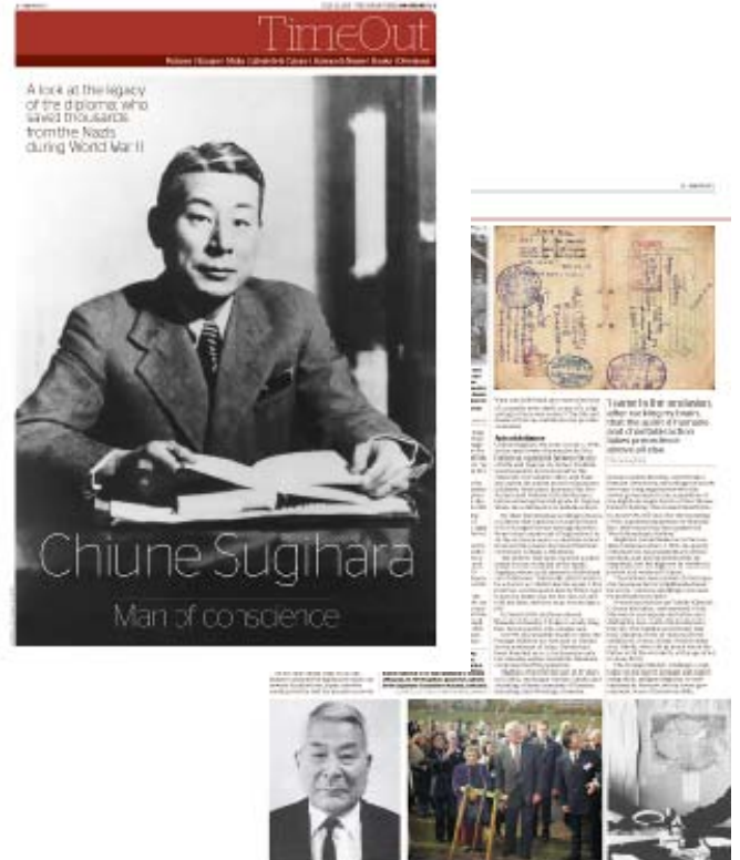
2015 年 7 月 12 日 杉原 千畝氏の記事