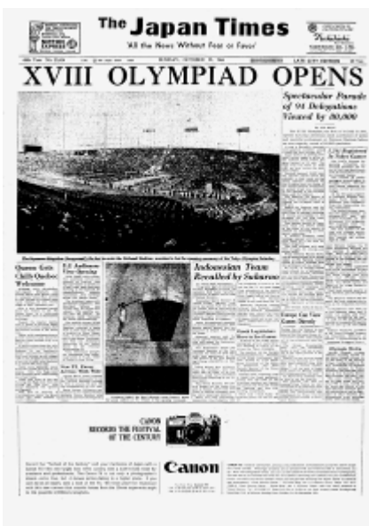
1964年10月11日 東京オリンピック開幕。94カ国の代表団、華やかに入場行進。観客8万人