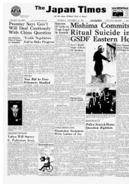
1970年11月26日 三島由紀夫、陸上自衛隊東部方面総監部で割腹自殺