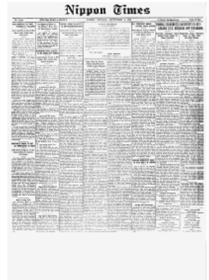
1945年9月3日 ポツダム宣言受諾の天皇詔勅 無条件降伏正式文書、横浜港沖に停泊中の戦艦ミズーリ号上で調印