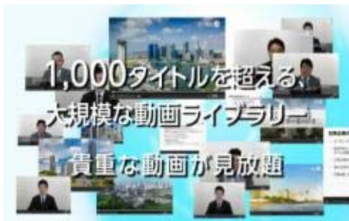
【ビデオコンテンツの一例】

収録国はアジアでニーズが高い 6 カ国 (台湾、タイ、シンガポール、インドネシア、フィリピン、ベトナム) です。現地の専門家が日本語で解説しています。法制度や外資規制など、ビジネスに必要な情報をカテゴリ別に収録している他、駐在員や留学生の暮らしに役立つ生活情報も豊富に収録されています。また、収録形式が統一されているので、国別の比較も容易です。