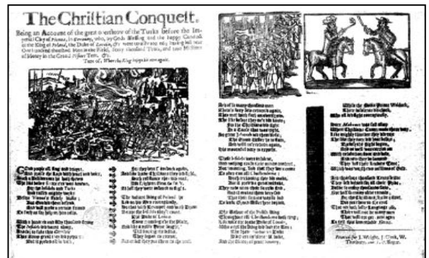
キリスト教の征服 (1681年~1684年頃) オスマン帝国の第二次ウィーン包囲に対する ヨーロッパ連合軍の勝利を伝えるバラッド