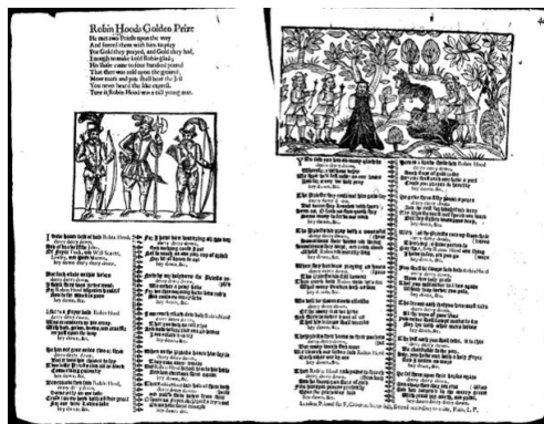
ロビン・フッドと強欲な僧侶 (1650年) 中世以来の口承バラッドも印刷に付された