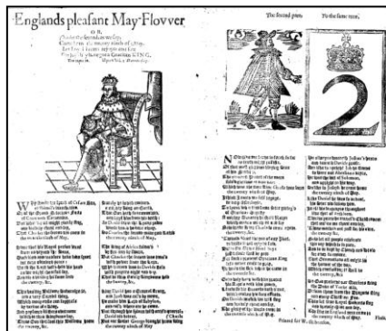
5月の花の喜び (1660年) チャールズ2世による王政復古を伝え、 歓迎するバラッド