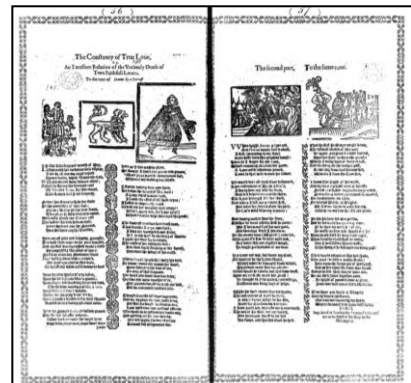
真の愛の貞節、誠実な恋人たちの早すぎる死 (1635年) ロマンズは大いに好まれた