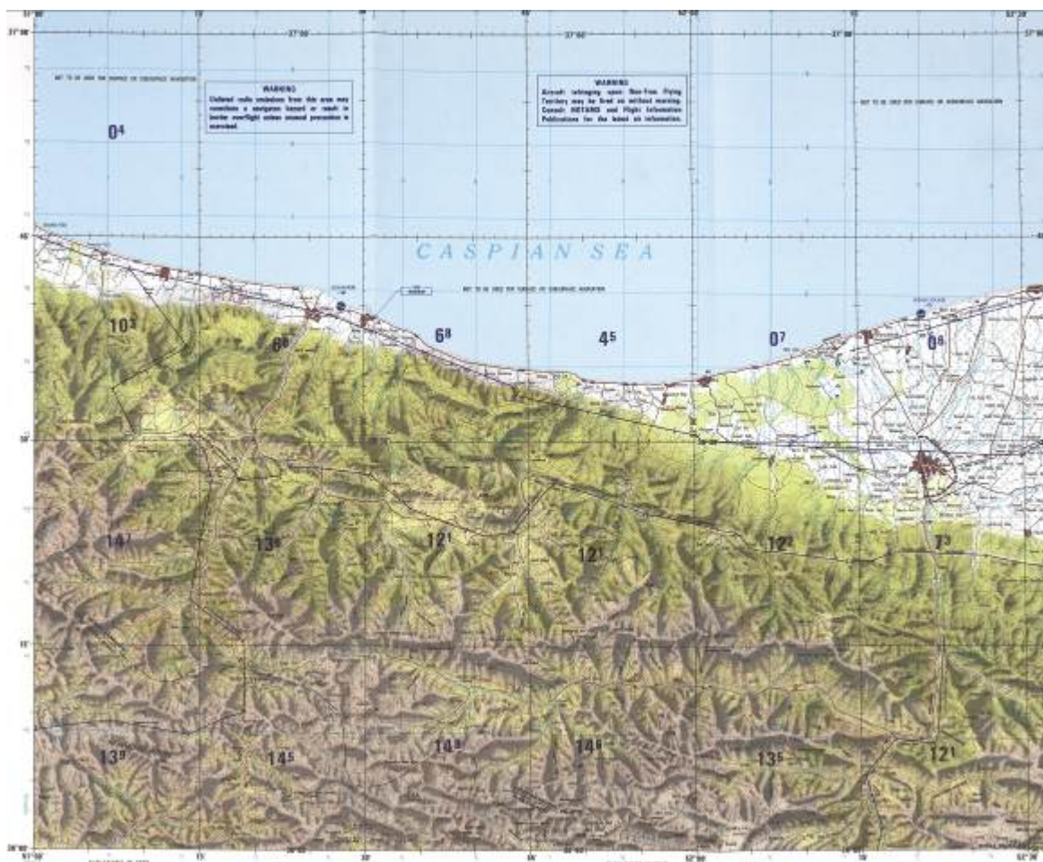
1:250,000 縮尺地形図サンプル