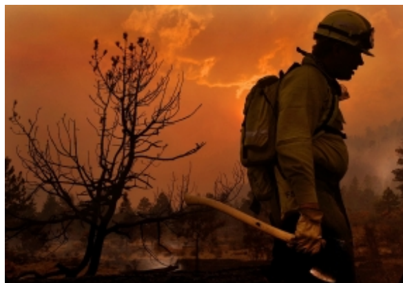
▲ピューリッツァー賞を受賞した写真シリーズ「コロラドの山火事に関する写真」からの一枚

当コレクションには、ピューリッツァー賞を受賞した「コロラドの山火事に関する写真」、「コロンバイン高校銃乱射事件の直後の生徒達の写真」、イラク戦争で戦死した海軍人の葬儀の舞台裏を追ったトッド・ヘスラー