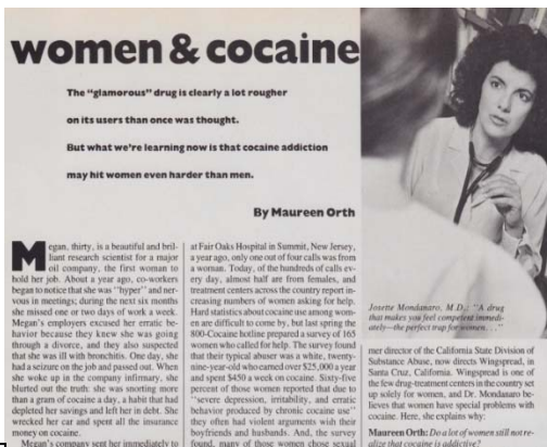
女性と社会に関わる問題 麻薬が女性にあたる影響

さらに、ケイト・ショパン、イーヴリン・ウォー、ウラジーミル・ナボコフ、カースン・マッカーズによる文学作品、ウインストン・チャーチルやバートランド・ラッセルによる投稿記事、リー・ミラーによる戦時中の報道写真記事、マレーネ・ディートリッヒやビートルズ、ニコール・キッドマン、ビヨンセなど時代を代表するポップカルチャーのスターや、ジャックリーン・ケネディやミシェル・オバマといったファーストレディの特集記事も掲載しています。時代を飾る著名人の記録ともいうことができます。