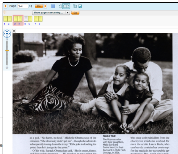
紙面イメージと、記事に付与された索引(部分)。