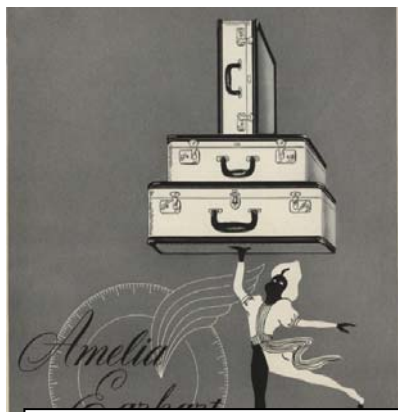
時代と流行をかいまみる 女性飛行士 America Earhart ブランドの 旅行鞆の広告