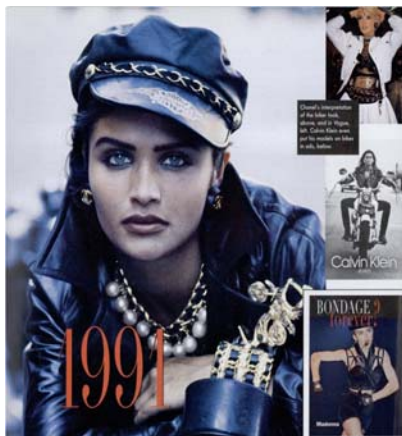
過去のファッショントレンドを振り返る 1991年のファッション特集