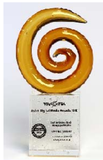
「特別賞」受賞トロフィー

ヨミダス歴史館サイト ( http://www.yomiuri.co.jp/rekishikan/ ) によると同協会副代表兼アジア太平洋局長のトマス・ジェイコブ氏は「当初は金賞を2つ出すことも検討されたが他の受賞サイトがいずれもニュースに特化されているため、並列は避けた、新聞の価値を高める、非常に独創的なサービスだ」とのことです。高い評価を得られたことが伺えます。