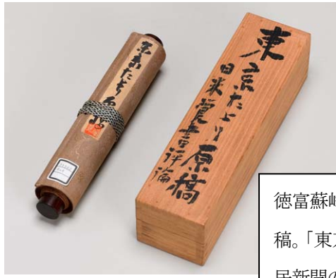
徳富蘇峰「日米覚書評論」の原稿。「東京だより」の見出しで国民新聞の一面に掲載された。